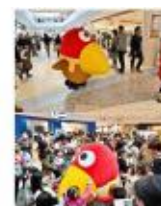
キョロちゃん グリーティングの様子