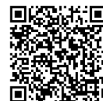
特設ウェブサイト