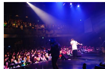
開催時の様子(渋谷)