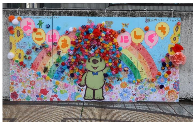
前回のローズフェスタの様子