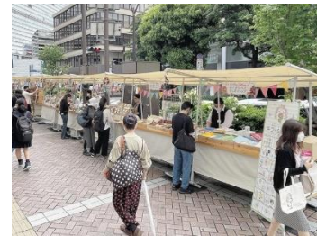
前回のローズマーケットの様子