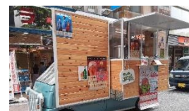
前回のキッチンカーの様子