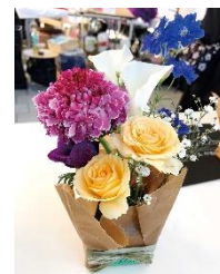
フラワーラリー (イメージ)