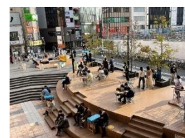
イートテラス(イメージ)