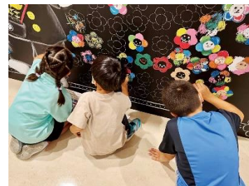
ミューラルアート フラワーワークショップ（イメージ）