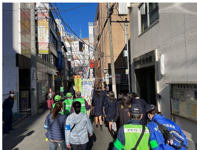
「防犯パトロール」（イメージ）