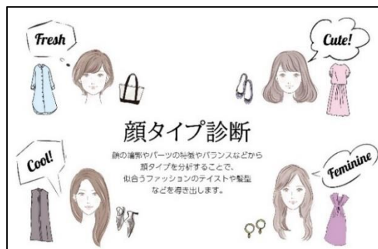
「顔タイプ診断 ® 」(イメージ)